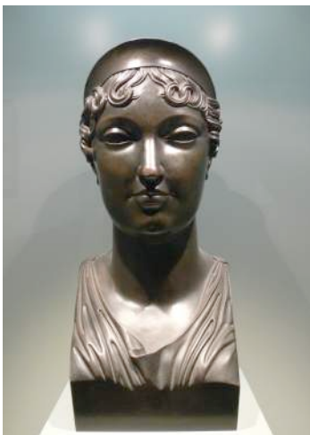
Abb.4 Marie Louise. Bronzestatuette von Jacques-Edme Dumont, Paris 1810

Neben seinen zahlreichen Statuetten und Statuen schuf Jacques-Edme die bekannte Büste von Marie Louise, der Herzogin von Parma und Ehefrau von Napoleon.