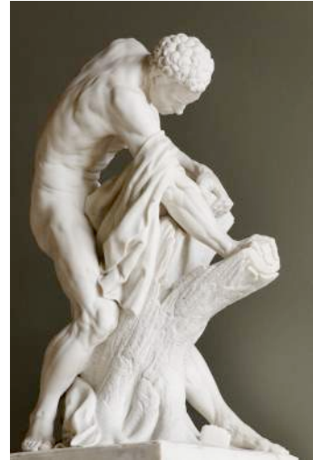
Abb.3 Milo von Croton. Skulptur von Edme Dumont, 1768, Louvre Paris

Obwohl Edme Dumont im Alter von 28 Jahren mit dem Prix de Rome ausgezeichnet wurde, blieb er in Paris, um dort zu studieren. Sein bekanntestes Werk, eine Statuette des Milo von Croton, ist im Louvre ausgestellt.