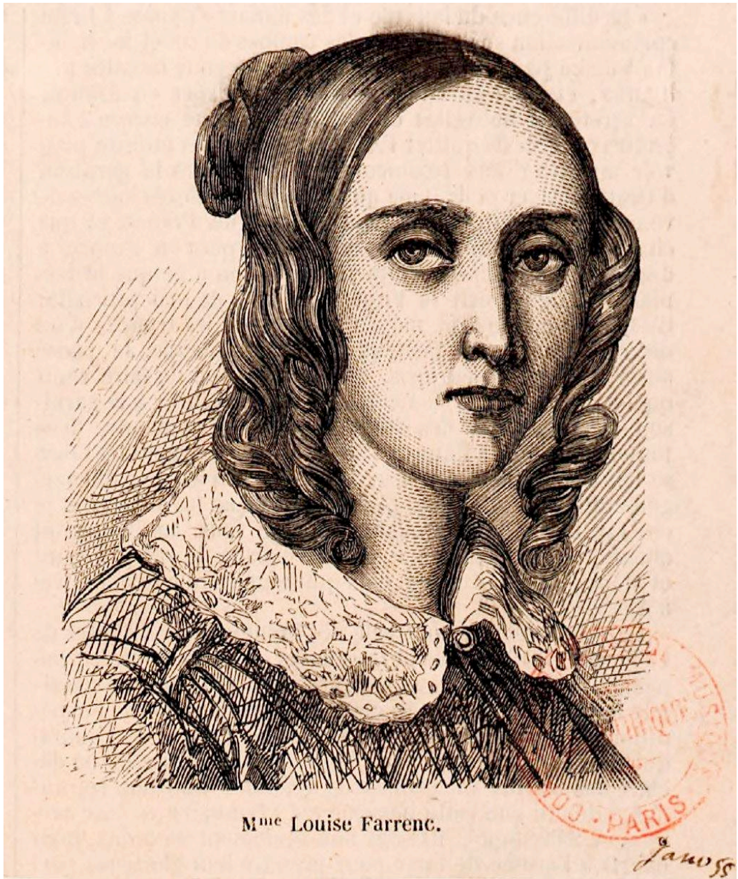
M me Louise Farrenc.