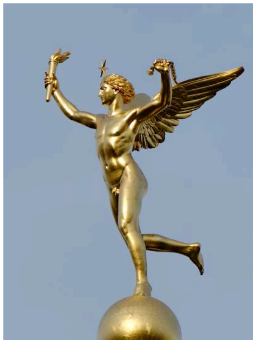
Abb.5 Le Génie de la Liberté . Juli-Säule, Place de la Bastille . Bronzestatue von Augustin-Alexandre Dumont, Paris 1833

Ab 1838 war Augustin-Alexandre Dumont Mitglied des Institut de France . 1852 wurde er Professor an der École des Beaux-Arts in Paris. Er genoss großes Ansehen als Künstler in Frankreich und wurde mit zahlreichen Auszeichnungen gewürdigt. 1875 musste Augustin-Alexandre aufgrund einer Lähmung seinen Beruf als Bildhauer aufgeben.